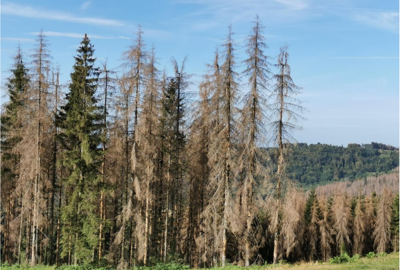
Cause du changement climatique, la multiplication des épicéas scolytés dans les Vosges se constate jusque dans le Jura. ©UCFF Août 2020