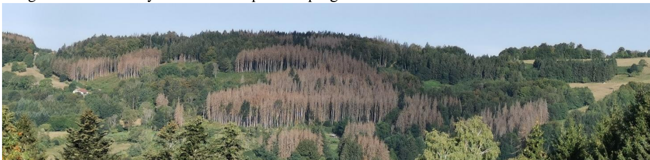
Pessière touchée par les scolytes dans les Vosges Saonoises à 800 mètres d'altitude. Les arbres meurent sur pied. ©UCFF Août 2020.

Outre la quantité de bois touchés, c'est l'extension géographique des populations de scolytes qui inquiète. En effet, en 2019-2020 après les zones de plaine, les insectes ont progressé dans le sud du massif des Vosges. Désormais, les plateaux du Doubs et du Jura, ainsi que le centre du massif des Vosges en altitude moyenne voient l'épidémie progresser.